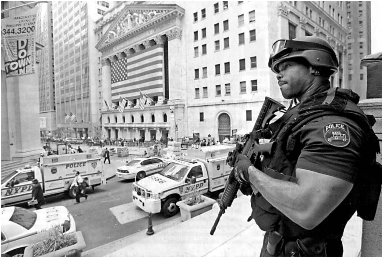
El gran desafío de Obama es que su programa para estimular la economía estadounidense funcione después de la crisis desatada el 2008. Han desaparecido 650 billones de dólares de los bolsillos estadounidenses.

reconocidas virtudes políticas para bajar el nivel de las expectativas que ha provocado en su país y en el planeta. Vencer los tremendos desafíos de la profunda crisis económica en Estados Unidos y del complicado conflicto asimétrico que ahora se