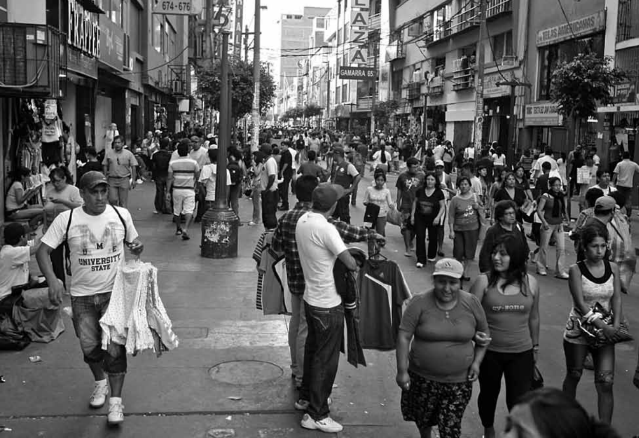
Gamarra no llega a la altura del mall, pero vende bastante, y lo popular de antes se da la mano con la nueva clase media de hoy.

último, se señala una tipología fruto de la subjetividad del autor en la que las personas se clasifican según también su propio criterio subjetivo. Esto es lo que lleva a decir a Arellano que la clasificación social no semejaría en el Perú a un triángulo, con una base de muchos pobres y un vértice superior de pocos ricos, lo que habría sido característico de épocas anteriores al neoliberalismo, sino como un rombo, con la mayor parte de la gente en medio. En este último caso, no porque