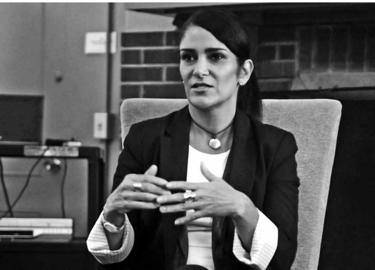
Lidia Cacho, periodista mexicana amedrentada por los traficantes, sigue investigando.

y actúan con carácter consultivo ante el Consejo de Europa. Si bien el Grupo puede y llega a expresarse de manera concreta con relación a los países de la Unión Europea, sus opiniones quedan en manos del Consejo para sugerir a los Estados las acciones o recomendaciones a las que se ha arribado. El Grupo en sí no tiene capacidad sancionadora.